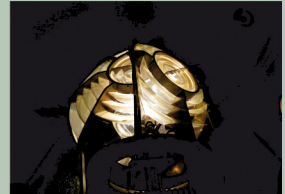
Parèll òptic del far de Tossa projectant la llum a l'horitzó el 2017.