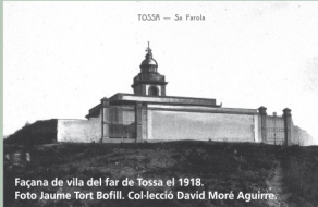
TOSSA — Sa Parola

Façana de vila del far de Tossa el 1918.